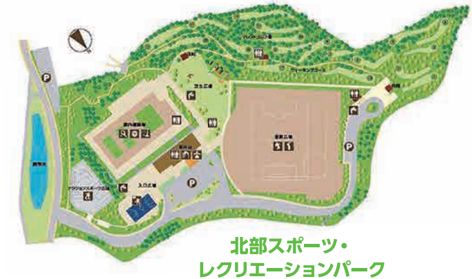
北部スポーツ・レクリエーションパーク

詳しくは/担当事務局:スポコミ東北事務局 平日10時~13時 026-296-9918 担当携帯電話090-8516-7025